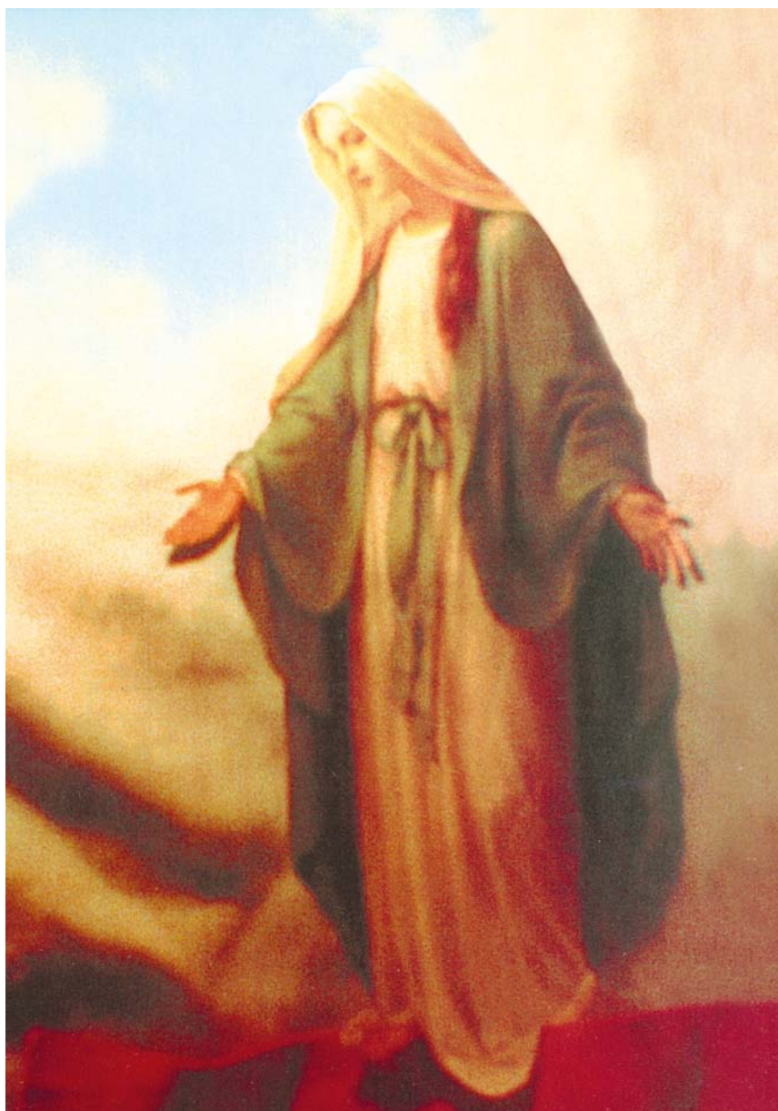
Foto av vår Moder. Visionären tog egentligen ett foto av något helt annat, men vid framkallningen av filmen upptäcktes denna bild.